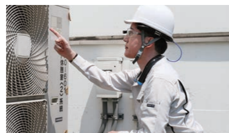
品質管理・メンテナンス